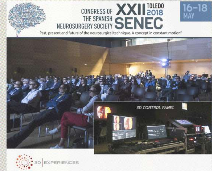
Proyección 3D en Congreso de Neurocirugía